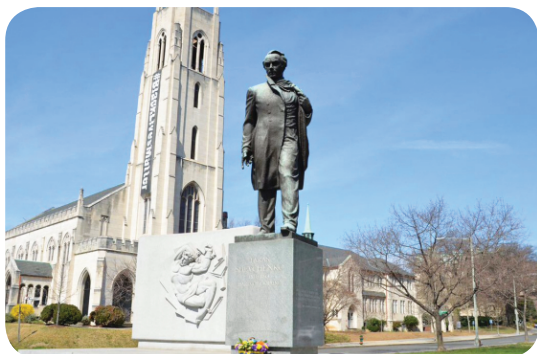
Пам'ятник Тарасові Шевченку у Вашингтоні, столиці США

У різних куточках світу стоять пам'ятники Тарасові Шевченку.