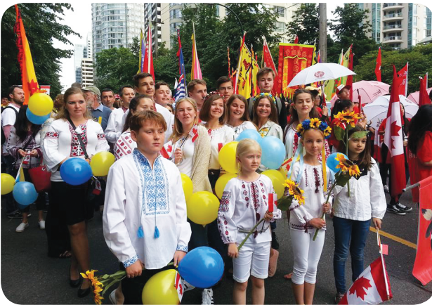
Українці в Канаді

У різних куточках світу живуть українці.