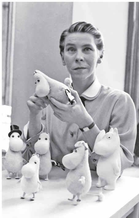
Туве Янсон. 1950-ті роки