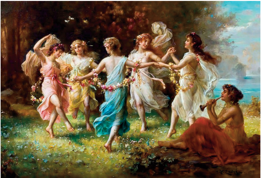
Ханс Зацка. Танець. Кінець XIX ст.