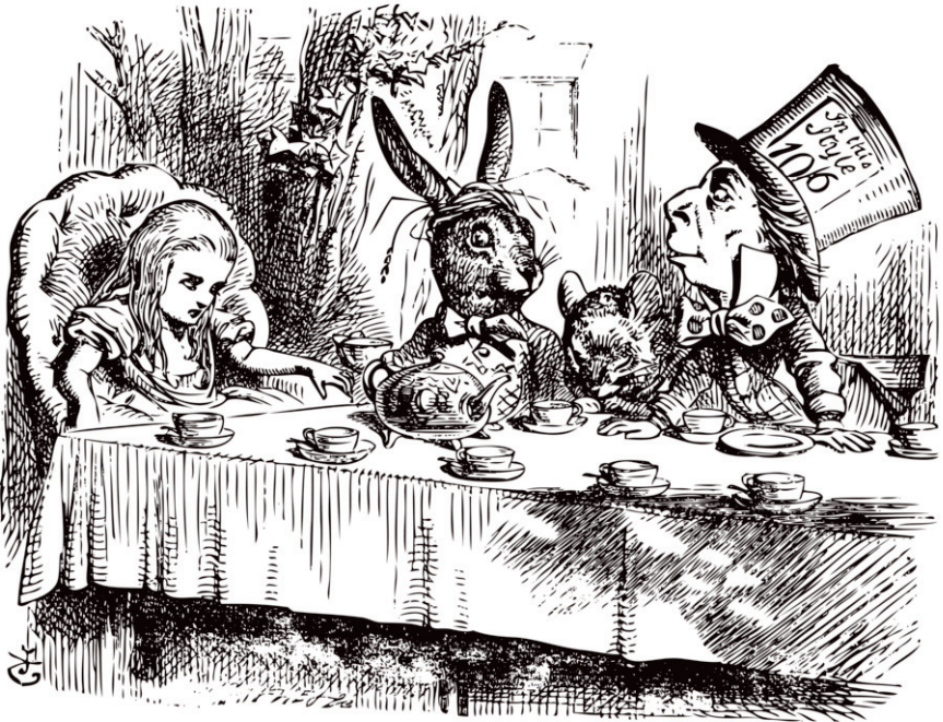
Дж. Тенніел. Ілюстрація до повісті-казки Льюїса Керролла «Аліса в Країні Див». 1866 р.

У сьомому розділі письменник також використовує давню англійську традицію створення загадок, що не передбачали відгадок. Капелюшник запитує Алісу: «Чим крук схожий на капшук?». Автор стверджує, що не все у світі має логічне пояснення, а те, що не має пояснення, не означає, що цього не існує взагалі.