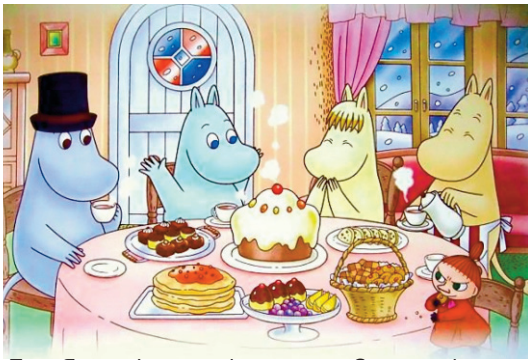
Туве Янсон. Ілюстрація до твору «Зима-чарівниця»

Однак мотлох, полишений прашуром перед дверцятами кахляної печі, стояв неторканий. На клапті паперу поруч старанно було виведено: "НЕ ЧІПАТИ!" З кухні долинав заспокійливий брязкіт – Мама мила посуд.