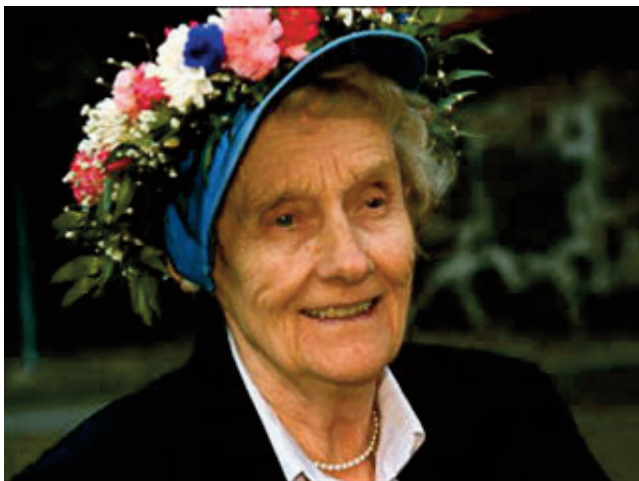
Астрід-Анна-Емілія-Ерікссон Ліндґрен. Початок 1990-х років

Ми живемо для того, щоб робити добро. Астрід Ліндґрен