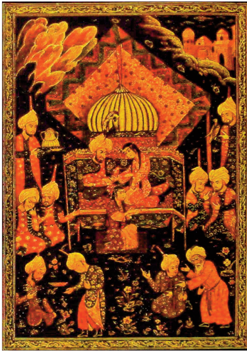
Н.Ушин. Обкладинка другого тома збірки казок «Тисяча і одна ніч». 1930 р.

Знання доводять тільки ділом. Знання – дерево, а діло – плоди. Арабська мудрість