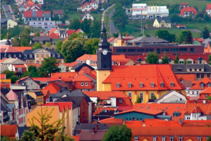
м. Ільменау, де був написаний вірш Й.-В. Гете «Нічна пісня подорожнього». Сучасне фото

Природа стала провідною темою творчості Гете. У статті «Природа» він із захопленням писав: «Природа! Ми нею оточені й охоплені – непереможно, нам не вийти з неї... Тільки через любов наближуються до неї. Вона добра – я славлю її у всіх її творіннях!».