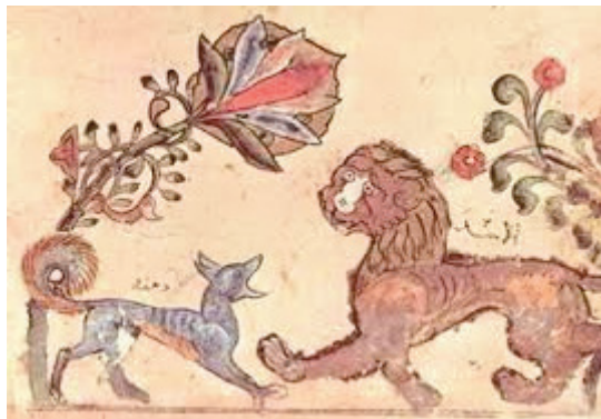
Невідомий автор. Ілюстрація до «Панчатантри». Фрагмент. бл. 1200 р.