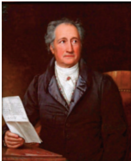
Йозеф-Карл Штілер. Йоганн-Вольфганг Гете. 1828 р.

Я вдячний, що із року в рік Росту я в лад природі... Йоганн Вольфганг Гете