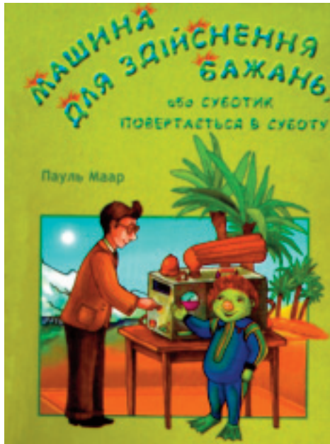
Обкладинка українського видання твору

За свої казкові твори, малюнки до них і сценарії Пауль Маар отримав високі відзнаки різних країн. Він став двічі лауреатом Німецької премії дитячої літератури, Державної премії Австрії, Німецької національної літературної премії та багатьох інших. 1998 року він отримав найвищу нагороду Німеччини – «Орден за заслуги перед Федеративною республікою Німеччини». Його називають найпопулярнішим серед сучасних дитячих драматургів у Німеччині, Австрії, Швейцарії. Мешкає письменник у старовинному німецькому місті Бамберг разом із дружиною та дітьми.