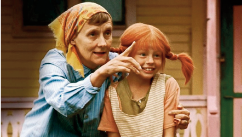
Астрід Ліндґрен на зйомках фільму «Пеппі Довгапанчоха». Режисер Улле Хелльбом, Швеція, 1969 р.