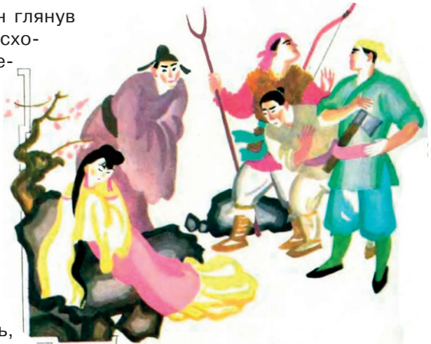
О. Михайлова-Родіна. Ілюстрація до казки «Червоний ліхтарик». 1991 р.

– Якби оце зараз додому повернутись, прямо до Сяогуй, то не треба мені було б ніякого іншого щастя!