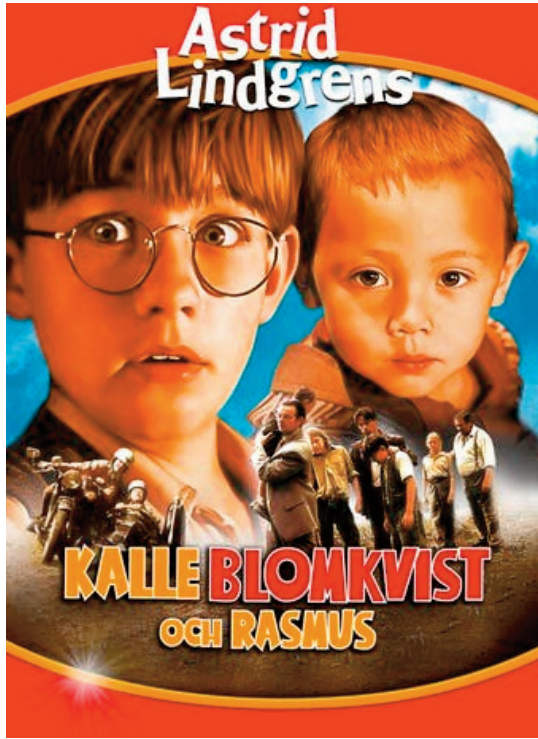
Постер до кінофільму «Калле Блюмквіст та Расмус». Режисер Йоран Кармбак, Швеція, 1997 р.