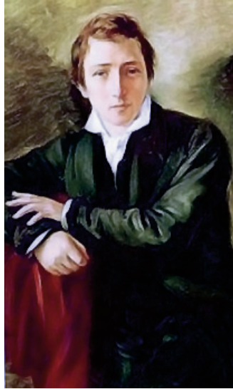
Моріц Опенгейм. Генріх Гейне. 1831 р.

Гуляю між квітками І сам між них розквітну... Генріх Гейне