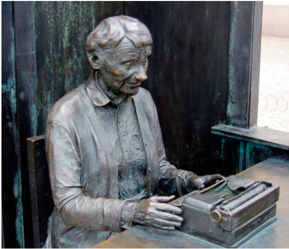
А. Ліндгрєн та її друкарська машинка. Автори: Марі-Луїз Екман та Стора Торгет, Віммербю, Швеція, 2007 р.

Твори Астрід Ліндгрєн не тільки розважають. У своїх казкових історіях мисткиня ніколи не обходила серйозних проблем, з якими стикаються дорослі й діти – непорозуміння в родині, самотність, хвороби. Письменниця відверто говорить зі своїми читачами про суспільні проблеми, пов'язані зі злочинністю та насильством. Маленькі герої та героїні Астрід Ліндгрєн, якщо того потребують обставини, мужньо встають на захист слабких, відважно вступають у двобій з небезпечними злочинцями. Пеппі Довгапанчоха та Калле Блюмквіст зі своїми вірними друзями стоять в обороні правди й справедливості, їхніх благородних учинків вистачило б на багатьох дорослих. Секретом власної сили та