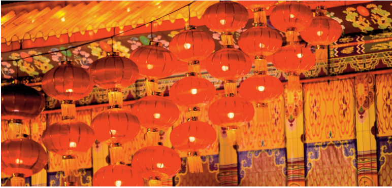
Традиційні китайські червоні ліхтарики. Сучасне фото