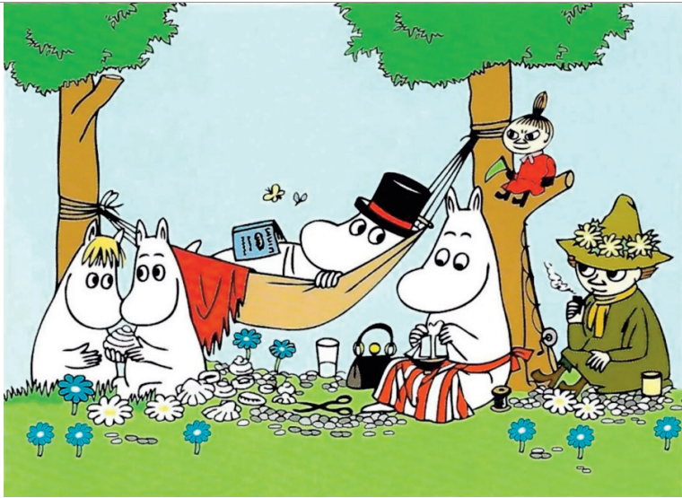
Туве Янсон. Ілюстрація до твору «Країна мумі-тролів»