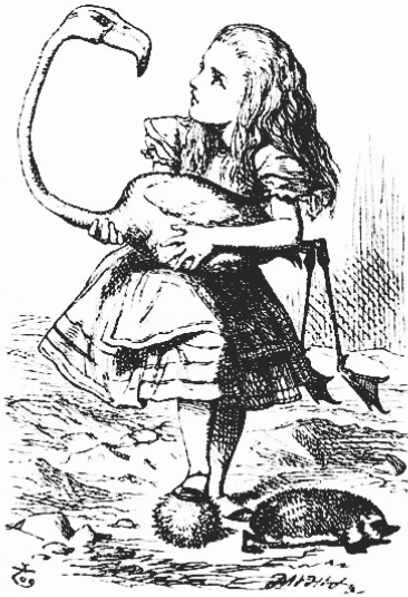
Дж. Тенніел. Ілюстрація до повісті-казки Льюїса Керролла «Аліса в Країні Див». 1866 р.