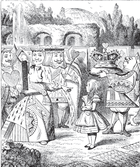
Дж. Тенніел. Ілюстрація до повісті-казки Льюїса Керролла «Аліса в Країні Див». 1866 р.

І ось, пробравшись крізь вузький прохід, вона вступила нарешті до чарівного саду з барвистими квітниками й прохолодними водограями.