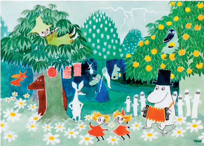
Тове Янсон. Ілюстрація до твору «Країна мумі-тролів»

До Чарівника потягнулася вервечка лісових мешканців, котрі пишали і дзижчали, реготали й горланили; кожен хотів сповнення свого заповітного бажання. Чарівник був у такому чудовому гуморі, що залюбки перечаровував, якщо хтось, не подумавши спершу як слід, просив у нього сповнення безглузвих забаганок. Знову розпочалися танці, до саду прикотили тачки зі свіжими оладками. Гемуль один за одним запускав у небо феєрверки, а Тато Мумі-троля виніс у сад свої Мемуари у чудовій новій оправі й уголос читав про своє дитинство.