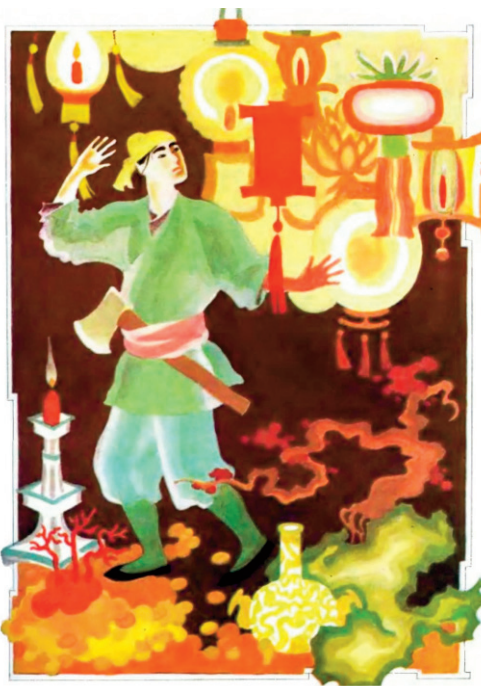
О. Михайлова-Родіна. Ілюстрація до казки «Червоний ліхтарик». 1991 р.