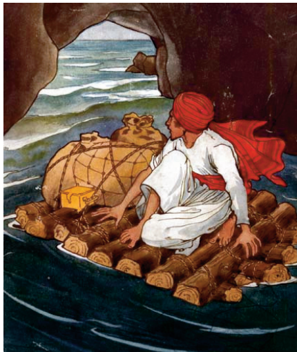
Рене Бул. Ілюстрація до першої подорожі Синдбада. 1898 р.

В образі купця Синдбада втілено прагнення арабського народу до відкриттів невідомих морів і земель, до опанування широкого світу за межами їхньої держави. Арабські купці мандрували морями й океанами в Індію та Китай, долаючи тисячі кілометрів. Синдбад-Мореплавець вирішив на власні очі побачити чудеса світу, найдивовижніші місця інших країн. Жага пошуків і відкриттів кликала арабського купця до нових пригод. Усього Синдбад здійснив сім подорожей. У першій казці Синдбад опинився на острові, який виявився насправді величезною живою рибиною... Чи зміг повернутися Синдбад до свого рідного міста Багдада – читайте!