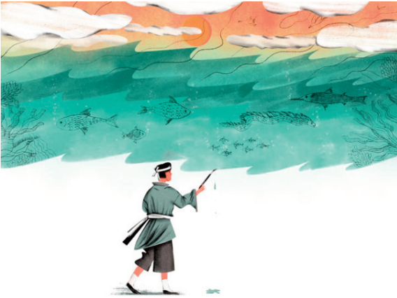
Марія Фоя. Ілюстрація до китайської народної казки «Пензлик Маляна». 2020 р.

«Нехай гори малює... Ні, ні. В горах страшні звірі водяться. Хай краще море», – думав імператор.