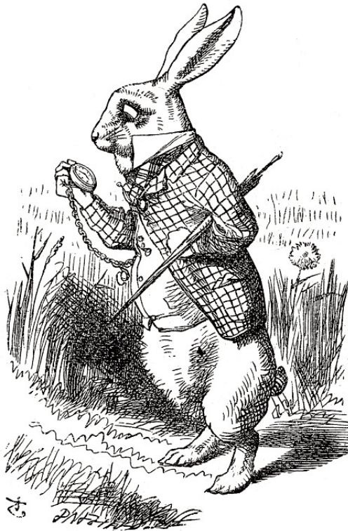
Дж. Тенніел. Ілюстрація до повісті-казки Льюїса Керролла «Аліса в Країні Див». 1866 р.

У перших двох розділах автор вводить свою героїню Алісу у фантастичний світ, чарівну атмосферу якого створюють дивовижні події (гонитва за Білим Кроликом, падіння дівчинки в його нору, знаходження загадкової кімнати, утворення від сліз Аліси цілого озера), казкові персонажі (Білий Кролик і Миша, які вміють розмовляти; птахи й звірі, що опинилися в озері сліз) і предмети, наділені незвичайними властивостями (з допомогою напоїв і їжі Аліса збільшується або зменшується, золотий ключик має відчинити дверцята в чарівний садок). На початку твору Льюїс Керролл протиставляє нудьгу і розчарування Аліси від книжки «без малюнків та розмов» (ідеться про надто повчальні й нецікаві для дітей твори того часу) силі творчої фантазії, де вже не може бути ніякого суму. Стрімкий рух героїні в різних просторах, що дивним способом змінюються, а також швидка зміна її самої цілком відповідають законам чарівної казки.