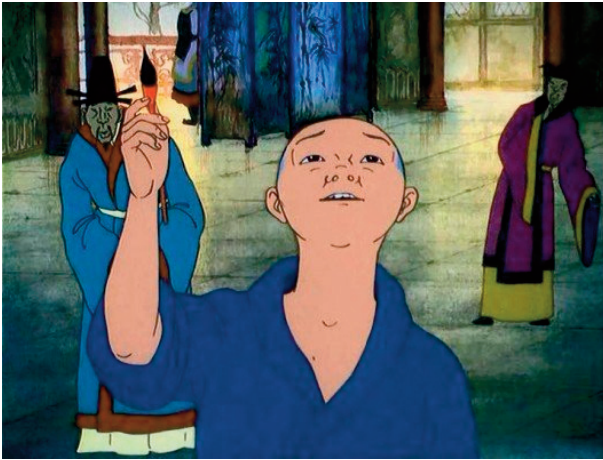
І. Олейников. Кадр із мультфільму «Пензлик Маляна». Режисер В. Угаров. 1997 р.