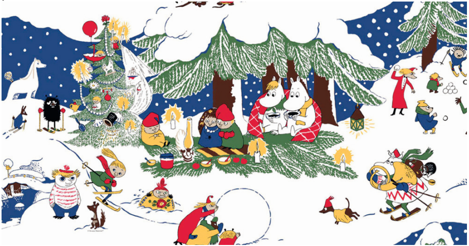
Туве Янсон. Ілюстрація до твору «Країна мумі-тролів»

Наступного ранку прокинулася уся родина. Прокинулася, як і належить прокидатися навесні, – від голосного, веселого тренькання катеринки.