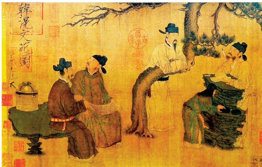
Хан Хуан. Сад учених. VIII ст.