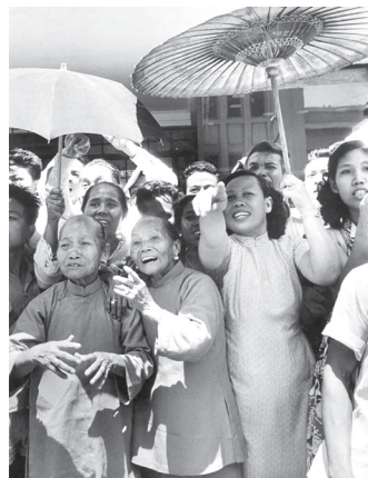
Мешканки Бандунга (Індонезія) вітають лідерів азійських та африканських держав під час міжнародної конференції 1955 р.

Nota bene! П'ять принципів мирного співіснування, відомі як принципи «панчашила» (дослівно зі санскриту «п'ять чеснот», «п'ять обітниць»), були вперше проголошені в преамбулі індійсько-китайської угоди 1954 р. Ця угода завершила кількарічний конфлікт між Індією та Китаєм через Тибет (урешті-решт Індія визнала Тибет частиною Китаю). Принципи «панчашила» складаються з таких положень: 1. Взаємна повага територіальної цілісності та суверенітету. 2. Ненапад. 3. Невтручання у внутрішні справи. 4. Рівність і взаємні вигоди. 5. Мирне співіснування. Ці принципи покладено також в основу підсумкових документів, ухвалених учасниками Бандунзької міжнародної конференції країн Азії та Африки в квітні 1955 р. На конференції було засуджено расову дискримінацію та колоніалізм «в усіх його проявах, як зло, яке треба швидко ліквідувати».