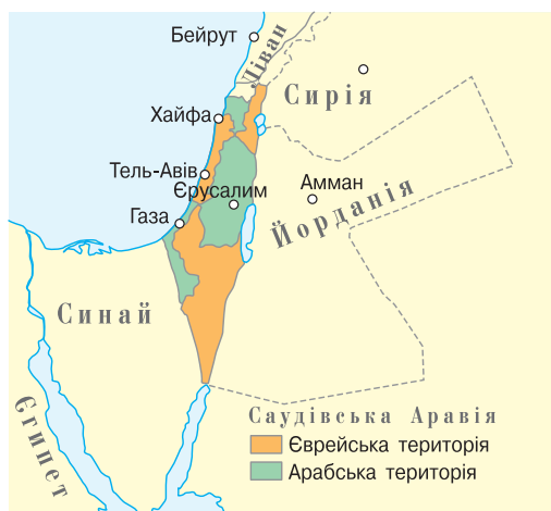
Розподіл Палестини за рішенням ООН від 1947 р.

Рубіжними віхами конфлікту стали чотири арабо-ізраїльські війни: 1948–1949 (війна Ізраїлю за незалежність, Палестинська війна), 1956