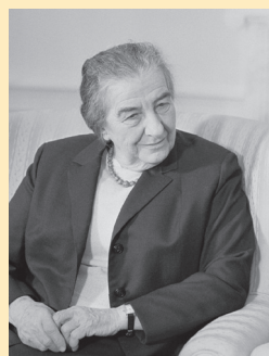
Голда Меїр – міністерка закордонних справ (1956–1966) і прем'єр-міністерка (1969–1974) Ізраїлю