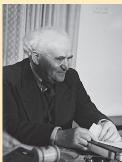
Давид Бен-Гуріон – прем'єр-міністр Ізраїлю в 1949–1953 і 1955–1963 рр.

З арабських країн найактивніше в конфлікті з Ізраїлем були задіяні Єгипет, Сирія, Йорданія, Ліван, Ірак. На боці Ізраїлю однозначно виступали Сполучені Штати, натомість араби отримували підтримку з Радянського Союзу (військовою технікою, озброєнням, паливом). Велика Британія і Франція пильнували за своїми інтересами в зоні Суецького каналу. Тому-то, коли єгипетський лідер Гамаль Абдель Насер у 1956 р. оголосив про націоналізацію компанії, яка управляла каналом, і заборонив прохід каналом ізраїльських суден і транспортних суден до Ізраїлю, ці держави (власниці великої кіль-