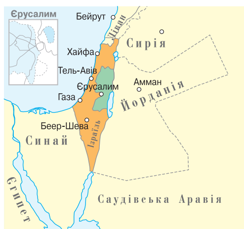
Розподіл Палестини після війни 1948 р.