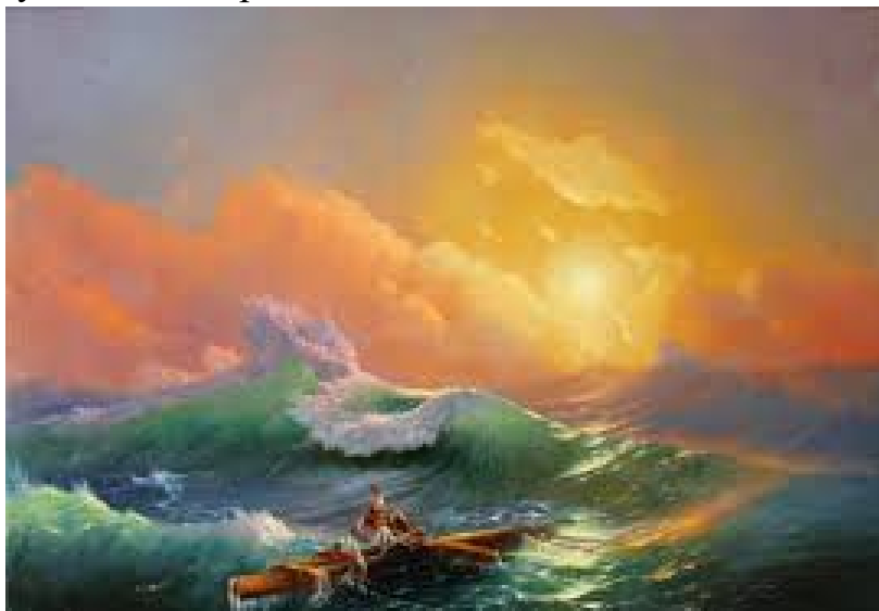
Іван Айвазовський «Дев'ятий вал»

поверхні води здіймаються високі хвилі і насуваються на берег? Як ви думаєте, хвилі тихо накочуються на берег?