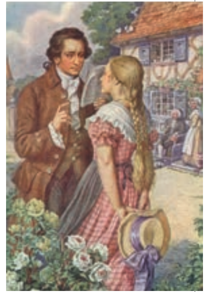
▲ Гете і Фредеріка. Поштівка, Німеччина, кінець XIX ст.

Фредеріка назавжди зберегла в серці кохання до поета і так і не вийшла заміж. А спомини про неї надихнули Гете на створення образу Маргарити у філософській трагедії «Фауст».