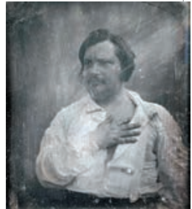
▲ Оноре де Бальзак. Фото, 1842

І взагалі батькові Бальзак зобов'язаний багато чим. Той був вульгарним матеріалістом і залишив низку творів із соціальних питань; над усе він ставив завдання фізичного поліпшення людської природи й за допомогою природознавства мріяв вирішити соціальні й моральні питання свого часу. Оноре успадкував його світогляд, здоров'я й залізну волю. Бальзак є яскравим типом письменника, що розвивався під впливом великих успіхів природознавства, серед суворої боротьби й жорстокої конкуренції, викликаній ростом промисловості. Його творчість пронизана прагненням перенести методи природознавства в художню літературу, стерти грань, що відокремлює літературу від науки.