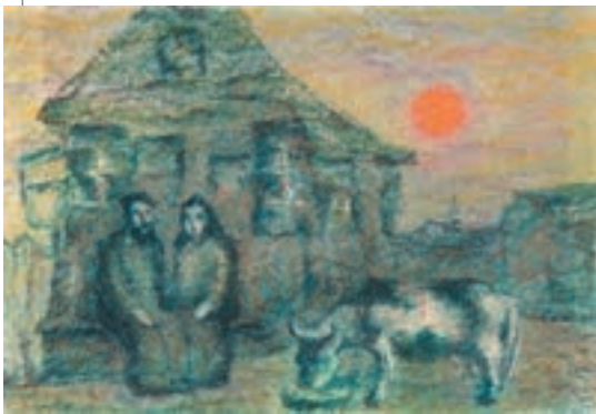
▲ Анатолій Каплан. Тев'є і Голда, 1976

От ви кажете: теперішні діти. «Синів ростив я і виховував...» – народжуй їх, поневіряйся, віддавай їм усі сили, працею, як віл, день і ніч, і чого, скажіть, будь ласка? Думаєш собі, може так, а може так, кожен згідно з своїм розумом і достатком. Чому, питаєте? По-перше, мене Господь благословив вродливими дочками.