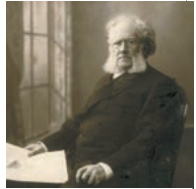
▲ Генрік Ібсен

Після переїзду до Христіанії (тепер Осло) Ібсен з головою поринув у суспільно-політичне життя. Його перша п'єса «Катиліна» була відхилена і театром, і видавцями. Тоді письменник видав її