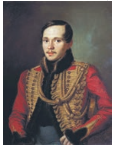
▲ Петро Заболотський. Михайло Лермонтов, 1837

Зятя свого, відставного капітана, красеня без серйозного статку, вона не любила. Зовсім не таким вона хотіла бачити чоловіка для своєї улюбленої доньки Марії, але все-таки дозволила їй одружитися «з любові». І ось через три роки після народження Мішеля (так його називала бабуся) слабка на здоров'я донька почала хворіти й незабаром пішла з життя. Єлизавета Олексіївна звинуватила в цьому зятя, і відтоді хлопчик ріс без спілкування з батьком. Доходило до того, що ледь на дорозі, яка вела до Тархан, здіймалася курява від екіпажу Юрія Петровича, який хотів побачити сина, за суворим наказом Єлизавети Олексіївни Михайла (як був, а якщо спав – загорнутого в ковдру) відвозили геть із Тархан, щоб той не побачив батька. Згодом поет гірко згадуватиме печальну долю самотніх, розлучених життям батька й сина.