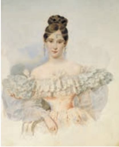
▲ Олександр Брюллов. Наталія Гончарова, 1831–1832

Сонце російської поезії закотилося, а доба Пушкіна і його сучасників-письменників отримала назву золотої доби російської літератури.