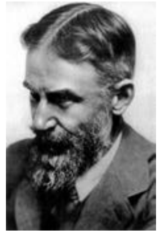
▲ Бернард Шоу

Бурхлива натура Шоу не задовольнялася очікуванням письменницької слави, а вимагала активної дії. У 1880-х рр. він поринув у громадсько-політичну діяльність, ставши вуличним промовцем. Згодом драматург згадував вулиці, переповнені людьми під час його виступів. Оратор міг би заробляти великі гроші, та грошей не брав, бо своїми політичними поглядами не торгував.