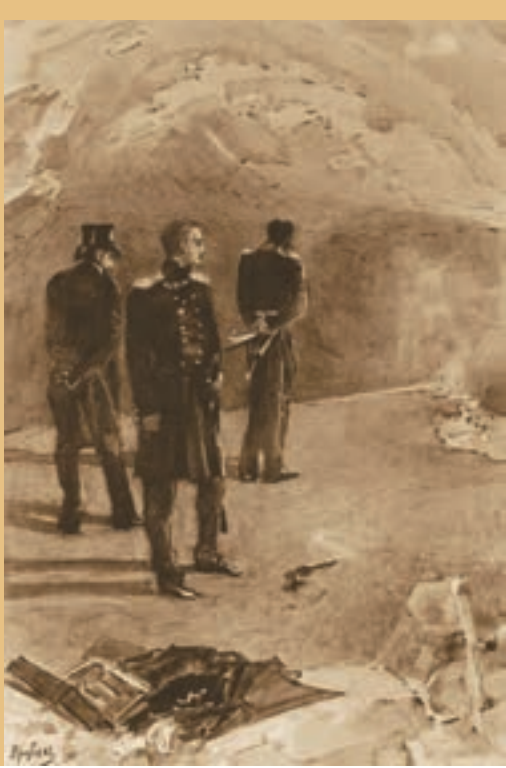
▲ Михайло Врубель. Дуель Печорі-на з Грушницьким, 1891