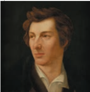
▲ Готліб Гессен. Портрет Гайне, 1828

Чудову пісню – пісню нову, О друзі, я буду співати! Ми хочемо царство небесне тут, На цій землі, збудувати.