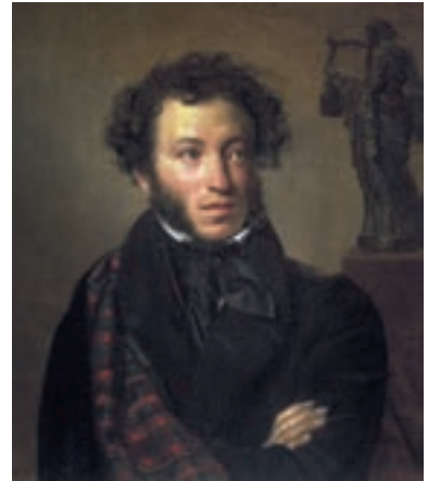
▲ Орест Кипренський. Олександр Пушкін, 1827

З мовчазного вайлуватого хлопчика, якого матір частенько лаяла за незграбність, він перетворився на стрункого ліцеїста. Юнак міг з місця перестрибнути кілька стільців, згодом став вправним вершником і фехтувальником, купався в крижаній воді, влучно стріляв (був завзятим дуелянтом), грався важкою палицею як тростинкою, щодня долаючи пішки з десятків верст, і був, попри маленький зріст і далекі від ідеалу риси обличчя, улюбленцем жінок.