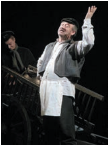
▲ Богдан Ступка у ролі Тев'є-Тевеля