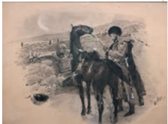
▲ Михайло Врубель. Казбич і Азамат, 1891

Максим Максимович звик до Бели, як до дочки. Печорін убивав її, як лялечку,