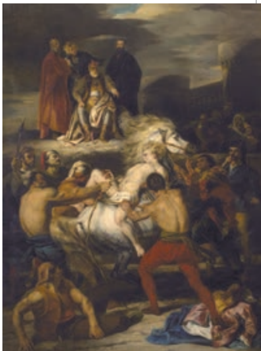
▲ Луї Буланже. Страждання Мазепи, 1827

Як дощ, на гриву, на живіт Мого коня, який весь час Щетиною в нестямі тряс, Від страху пирскав, горбив спину І мчав галопом без ушину. Я іноді хотів, щоб він Сповільнив трохи свій розгін, Ба ні – від зв'язаного тіла В нім наростала гнівна сила І ще прискорювала біг, І кожний рух, який я міг Зробити, щоб мій біль пом'як, Будив у ньому переляк. Я випробував голос мій – Він був і тихий, і слабкий, Але і цей найменший видих Конем сприймався, ніби вибух, Немов лунав мисливський ріг, І він стрибав, і швидко біг. Тим часом гострі ланцюги Врізались більше від ваги, Кривавим потом промокрілі, Який стікав по всьому тілі, А спрага пра́жила язик, Вогонь – і той би так не пік!