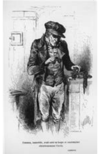
▲ Шарль Тамізьє. Гобсек, 1832

1 Метсю Габріель (бл. 1630–1667) – нідерландський художник.