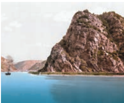
▲ Скеля Лор Лей на Рейні

Історію про дівчину, яка всіх, хто пливе Рейном біля скелі Лор Лей, зачаровує своїм співом, розповів у баладі німецький поет-романтик Клеменс Брентано.