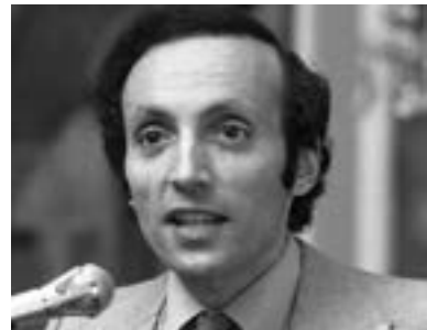
▲ Ерік Сігел

Книжка «Історія одного кохання» стала бестселером в США і була перекладена 33 мовами (в тому числі українською – переклад був опублікований